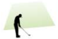
Korridor mit 40 m Breite und 30 m Länge im Längenbereich eines Holz 5 des Schülers